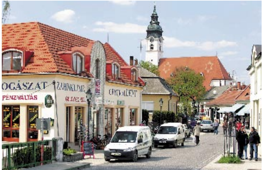
Bis zu 67 Prozent günstiger ist Zahnersatz in Ungarn. Wie hier in Mosonmagyaróvár haben sich Ärzte auf deutsche Zahn-Touristen eingestellt.

KORTMANN: Nein, das ist nicht sicher. Preisunterschiede bestehen übrigens nicht nur zwischen Deutschland und Polen, sondern auch in Deutschland von Zahnarzt zu Zahnarzt. Auch hier lohnt sich der Vergleich. In Bayern beispielsweise sind die Preise meist deutlich höher als in den neuen Ländern. Tipp: Von mehreren Zahnärzten Kosten-Voranschläge machen lassen.